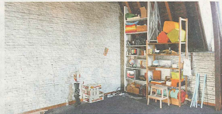
● Boven: Insight Outside van Line Boogaerts, linksonder: A Reader of Oppositions van Joachim Coucke en rechtsonder werk van Conny Kuilboer.

het werkproces tonen. Ook Joachim Coucke maakt met A Reader Of Oppositions een mooi beeld: hij zette een paar zwarte lederen schoenen op een krant. De veters zijn vervangen door een internetkabel.